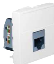
6 329 01