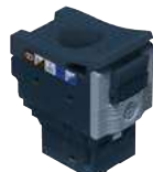
6 329 09