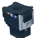
6 329 11