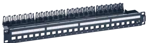
6 328 50

patch panely, keystone, krabice pre povrchovú montáž a zásuvky