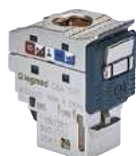
6 329 05