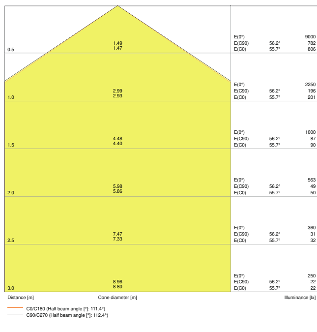
LDC typ cone