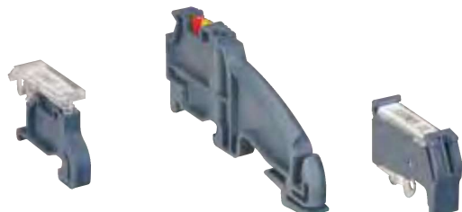
0 375 11 s držiakom štítkov obj. č. 0 395 96 0 375 12 s označením CAB 3 0 375 13 s držiakom štítkov Duplix 0 384 98