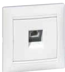
7 744 38 + 7 744 51