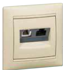
7 741 80 + 7 743 51