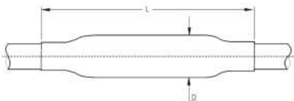
Rozmery L, D pozri tabuľku